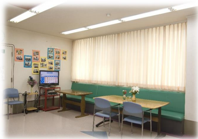
共用型デイサービス 吹上の杜 外観とフロア